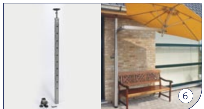
Balkon opspanning Fixation avec accessoires balcon Balcony anchorage Balkon-Klemme