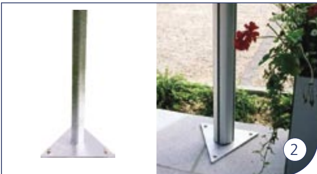
Driehoeksteun Support triangulaire Triangle support Spannvorrichtung