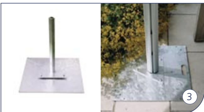
Voetplaat Piédestal Pedestal Podest