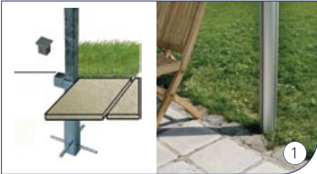
Betonanker Ancre de bétonnage Concrete anchorage Beton Bodenverankerung