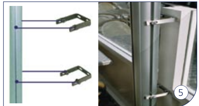
Wandverankering Inox voor paal Ancrages muraux inoxydables Wall anchorage stainless steel Edelstahl U-Bügel