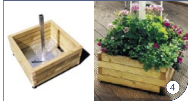
Bloembak Bac à Fleurs Flowerbox Blumenkasten